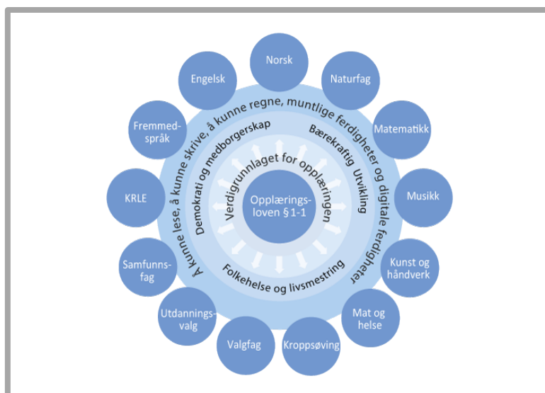
Grunnskolens fag (Meld. St.28 (2015-2016) Fag – Fordypning – Forståelse. En fornyelse av kunnskapsløftet).